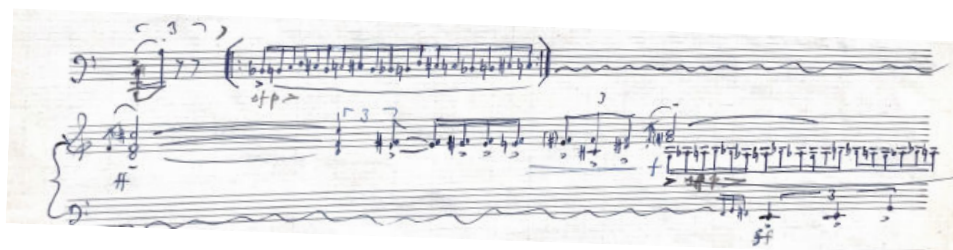
26. ábra: Dialoghi, IV. tétel aleatórikus improvizáció

Fejtörést okozott az előadók számára az aleatórikus rész (26. ábra). Ennek miéértjére a következő választ adta a szerző: „Miután a negyedik tételben az ametrikus zene összes ritmikai és regiszterbeli, tehát idő és térbeli kombinációit fokozatosan kimerítettem, a fokozásnak egyetlen lehetősége maradt még hátra, az aleatória, ahol az egymástól függetlenül improvizált (...) szólamok feszültsége visz a tétel csúcspontjához”. 17