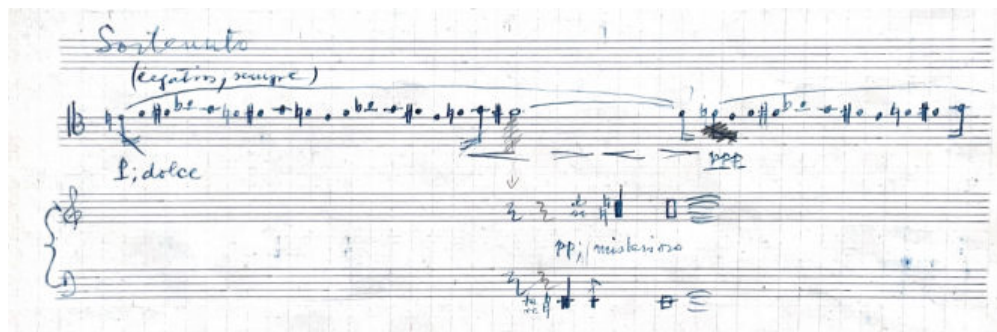
29. ábra: Dialoghi , 3. tétel fagott szólam „kromatikus bolyongás”

tartományban kötetlenül, legato , kromatikusan ismétlődő hangsor, mintha távoli halk zsongást imitálna, „kromatikusan bolyongana” (29. ábra).