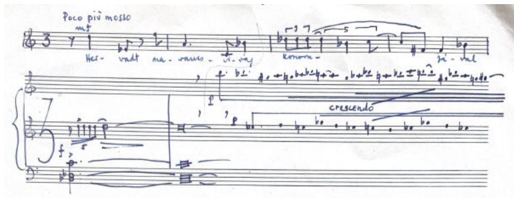
30. ábra: Lamenti , 1. tétel zongora felső szólamában „kromatikus bolyongás”