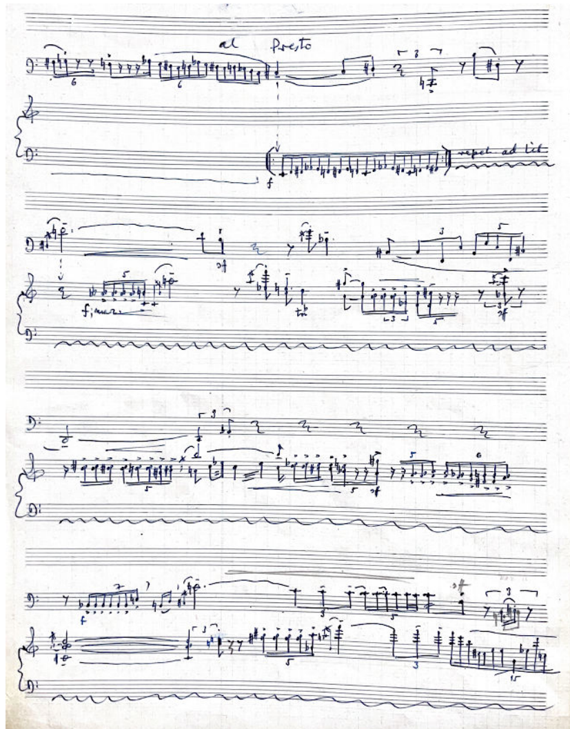
24. ábra: Dialoghi, IV. tételben ismétlődő kvintolák, repet. ad lib. aleatória

Egy ennyire forradalmain új dramaturgiában is megtalálhatók Kocsárnál a jól működő alapok, amelyek a zene követhetőségét teszik lehetővé azáltal, hogy egy, már korábról ismert érzetre épülnek. Az öt tétel öt kicsi történet, még akkor is, ha ezeket nem tagolja szünet. Az első tétel zongorakíséretében beazonosítható ismétlések láthatók, például a dallam ugyanazt a magasba törő zenei gesztust ismétli a fagottban, míg végül eléri a cisz' hangot (24. ábra). A második tétel hallhatóan egy szerény kíséretes fagott kadencia ( quasi cadenza ), a harmadik sostenuto tétel egy rendkívül halk, a tétel végén egyetlen forte b''-h'' hangközben kicsúcsosodó titokzatos zene. Attacca követi a negyedik tétel, melyben egy-egy zenei elem, mint például a tizenhatod staccato kvintola hangrepetálása, vagy az aleatória itt-ott felbukkanó ismétlése maga is segíti az egyes formarészek értelmezését.