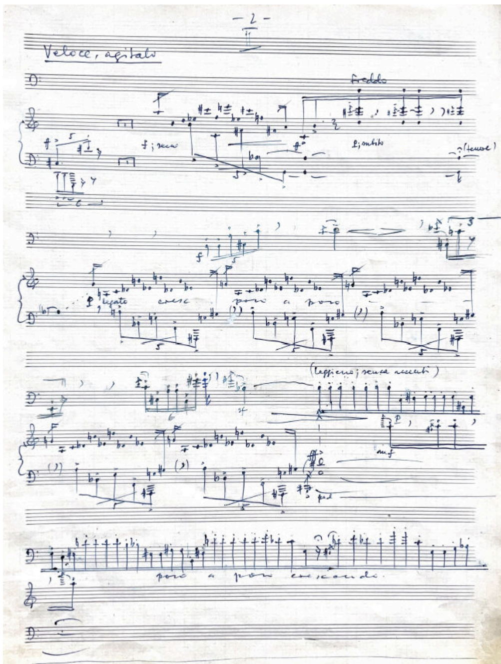
23. ábra: Dialoghi , II. tétel új notáció

A Földes-interjú 16 arról tudósít, mi történt a zeneszerző műhelyében a Dialoghi komponálása közben, melyek azok a megragadható, kulcsfontosságú elemek, amelyek – ha csak egy időre is, de – bekerültek Kocsár zenei kifejezésének gazdag tárházába.