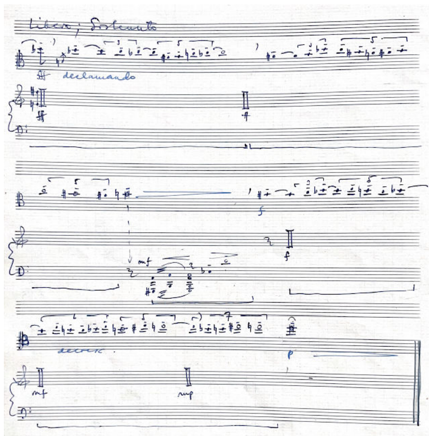
25. ábra Dialoghi, IV. tétel népdalszerű megformálás

Fejtörést okozott az előadók számára az aleatórikus rész (26. ábra). Ennek miéértjére a következő választ adta a szerző: „Miután a negyedik tételben az ametrikus zene összes ritmikai és regiszterbeli, tehát idő és térbeli kombinációit fokozatosan kimerítettem, a fokozásnak egyetlen lehetősége maradt még hátra, az aleatória, ahol az egymástól függetlenül improvizált (...) szólamok feszültsége visz a tétel csúcspontjához”. 17